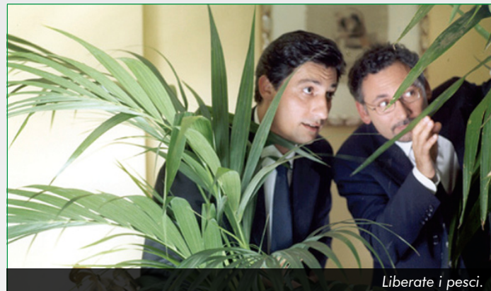
Liberate i pesci.