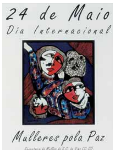
Mulleres pola Paz. Mercedes Ruibal. 1982. 59 x 45 cm.