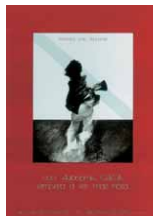
Coa autonomía Galicia empeza a ser mais nosa. Xaime Quessada. 1977. 80 x 60 cm.