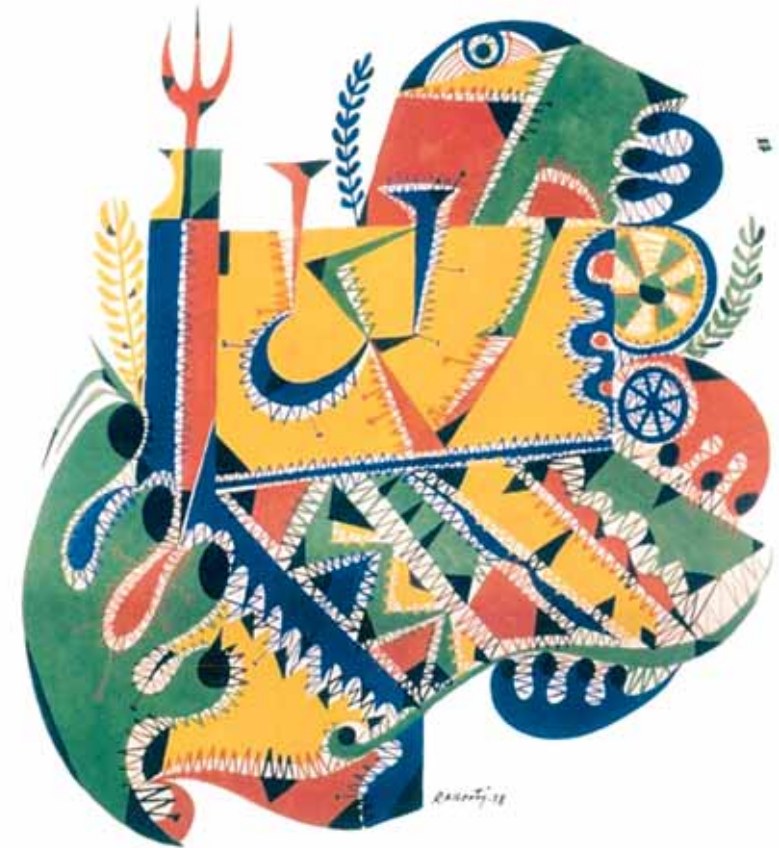
Rafael Alberti: 1º Congreso de la Confederación Sindical de CC.OO. 1978. 65 x 90 cm.