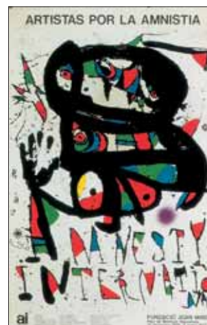
Artistas por la amnistía. Joan Miró. 1976. 75 x 48 cm.