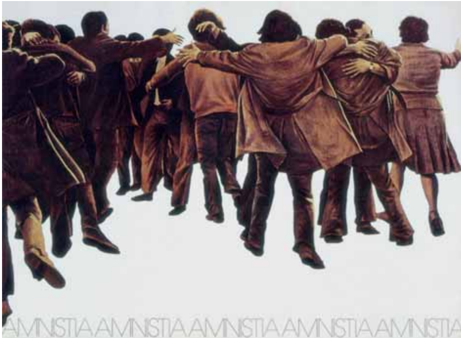
Amnistía. Juan Genovés. 1976. 50 x 68 cm.