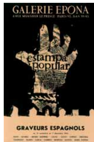
Estampa Popular. José Ortega. 1962. 64 x 44 cm.

haciéndolo en su consolidación y extensión. Por ello, la exposición no puede abarcar a todos aquellos que han producido los carteles que custodiamos en nuestros archivos, pero la selección es representativa y significativa.