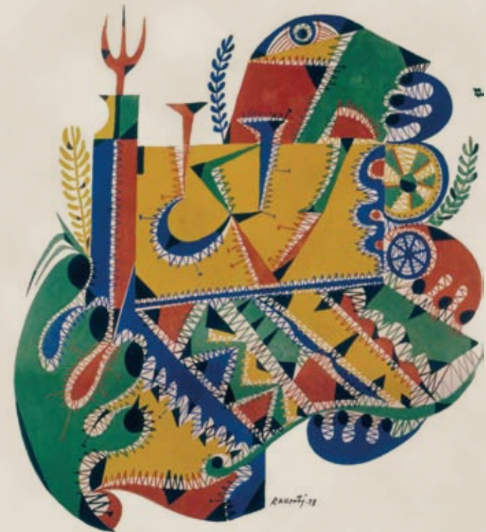
Rafael Alberti: 1º Congreso de la Confederación Sindical de CCOO 1978, 63x90 cm.

Centro Cultural Alcazaba. Ayuntamiento de Mérida, 23 de mayo - 26 de junio 2008 (C/ John Lennon, 5)